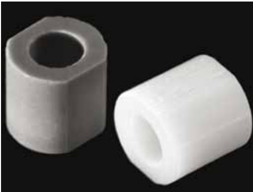
Lagerbuchsen aus \text{SiC} , \text{Si}_3\text{N}_4 und \text{ZrO}_2