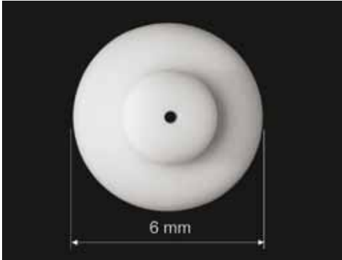
Düse mit hochpräziser Bohrung \varnothing 0,35 mm