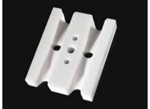
Düse aus \text{Al}_2\text{O}_3