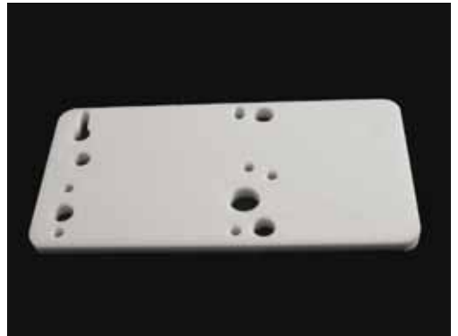
Aluminiumoxidplatte Dicke 5 mm, gelasert