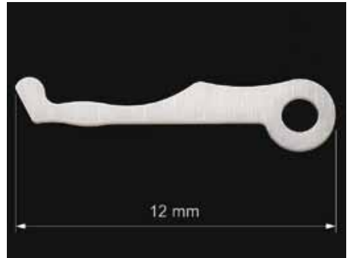
Hebel aus ZrO_2 , Dicke 0,6 mm