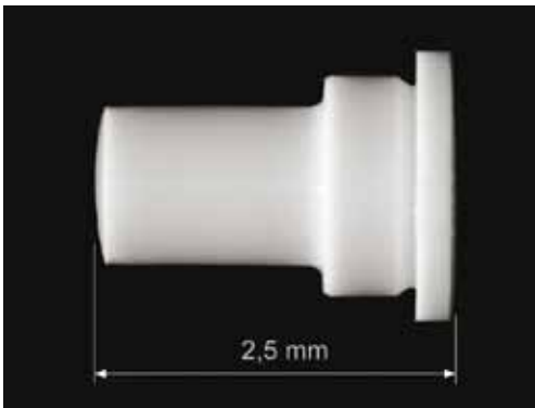
Lagerzapfen aus ZrO_2