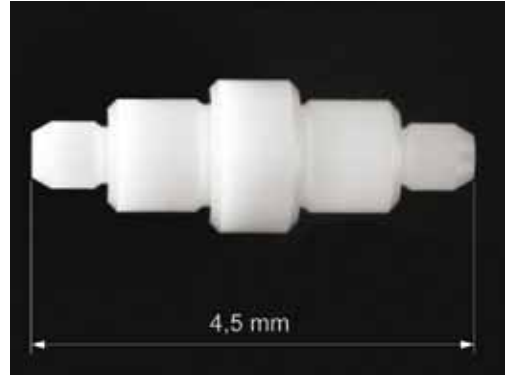
Welle aus ZrO_2